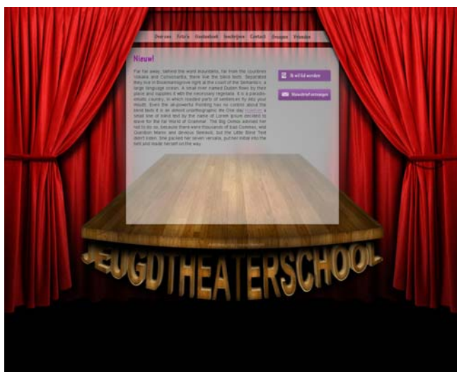
layout van de vernieuwde website

Vanwege de kosten worden er door ons geen acceptgiro's verstuurd. De lesbijdrage dient rechtstreeks over te worden gemaakt op rekeningnummer 1450.89.924 t.n.v. Stichting Theaterkring.